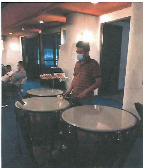
Ilustración 1 Ensayo no.1 de la Ópera K'iché Winaq, lobby de la Gran Sala del Centro Cultural Miguel Ángel Asturias.

Realicé ensayos artísticos de la Ópera K'iché Winaq interpretando los timbales en la sección de percusión. En este primer ensayo realizado en el Lobby de la Gran Sala del Centro Cultural Miguel Ángel Asturias a las 17 horas, se nos entregó la música y se le dio una lectura general a todos los números que componen la ópera, así también se fijaron algunos tiempos de ciertos números de la misma. Link de video del ensayo: https://drive.google.com/drive/folders/1wQoofaLjQgIJoYV40h-O8nebHdAVR-of?usp=sharing