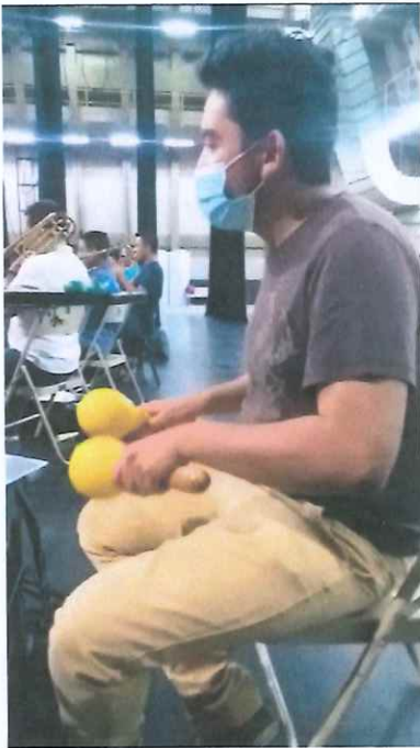
Ilustración 3: Ensayo no.2 de la Ópera K'iché Winaq en la Gran Sala del Centro Cultural Miguel Ángel Asturias.

Realicé ensayos artísticos de la Ópera K'iché Winaq interpretando los chinchines y el redoblante en la sección de percusión. En este segundo ensayo realizado en la Gran Sala del Centro Cultural Miguel Ángel Asturias a las 17 horas, se inició con dar una lectura de los números donde hay solistas, en este caso la soprano y el tenor. Se vieron tiempos y dinámicas para el acompañamiento de cada solista. Se ensayó también las partes del coro para su respectivo acompañamiento. Y de último se vieron números específicos donde el director trabajó varios pasajes importantes. Link de video del ensayo: https://drive.google.com/drive/folders/1WZzZNSkvOIPfMOXGCqADkN77j98b6Myr?usp=sharing ,