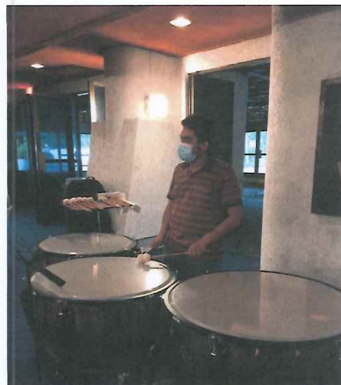
Ilustración 2: Ensayo no.1 de la Ópera K'iché Winaq, lobby de la Gran Sala del Centro Cultural Miguel Ángel Asturias.