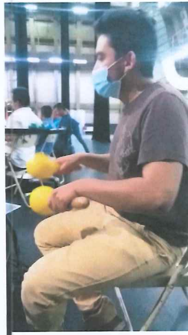
Ilustración 4: Ensayo no.2 de la Ópera K'iché Winaq en la Gran Sala del Centro Cultural Miguel Ángel Asturias.