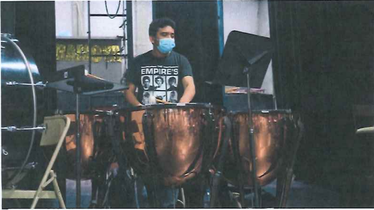
Ilustración 5: Ensayo no.3 de la Ópera K'iché Winaq en la Gran Sala del Centro Cultural Miguel Ángel Asturias.

https://drive.google.com/drive/folders/1_iGrWFHqicD0OA0RWwRSOjwks_UO3GAI?usp=sharing