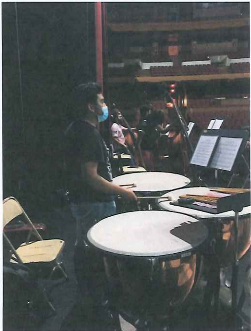
Ilustración 7 Ensayo no.3 de la Ópera K'iché Winaq en la Gran Sala del Centro Cultural Miguel Ángel Asturias.